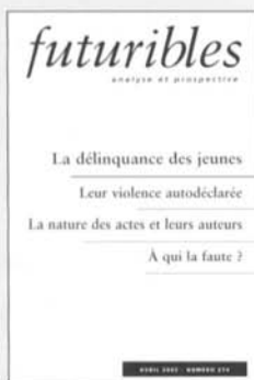
La délinquance des jeunes N° 274, avril 2002, 12 €