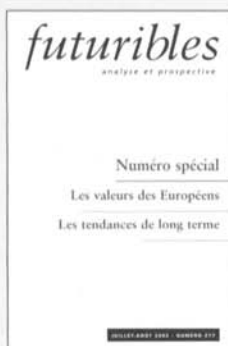
Les valeurs des Européens N° 277, juillet-août 2002, 20 €