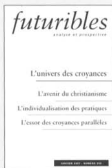
L'univers des croyances N° 260, janvier 2001, 11,89 €