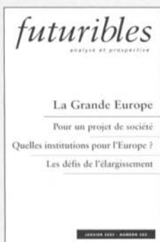
La Grande Europe N° 282, décembre 2002, 12 €