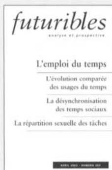
Les usages du temps N° 285, avril 2003, 12 €