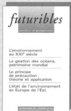
L'environnement n° 239-240, fév.-mars 99, 75 F