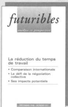
Le temps de travail n° 237, décembre 98, 73 F