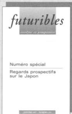
Le Japon n° 216, janvier 97, 70 F