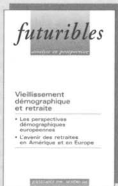
Le vieillissement n° 244, juil.-août 99, 75 F