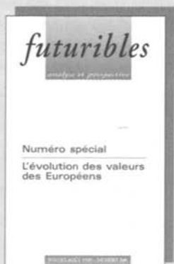
L'évolution des valeurs n° 200, juil.-août 95, 120 F

À retourner à Futuribles - 55, rue de Varenne - 75341 Paris cedex 07 - France