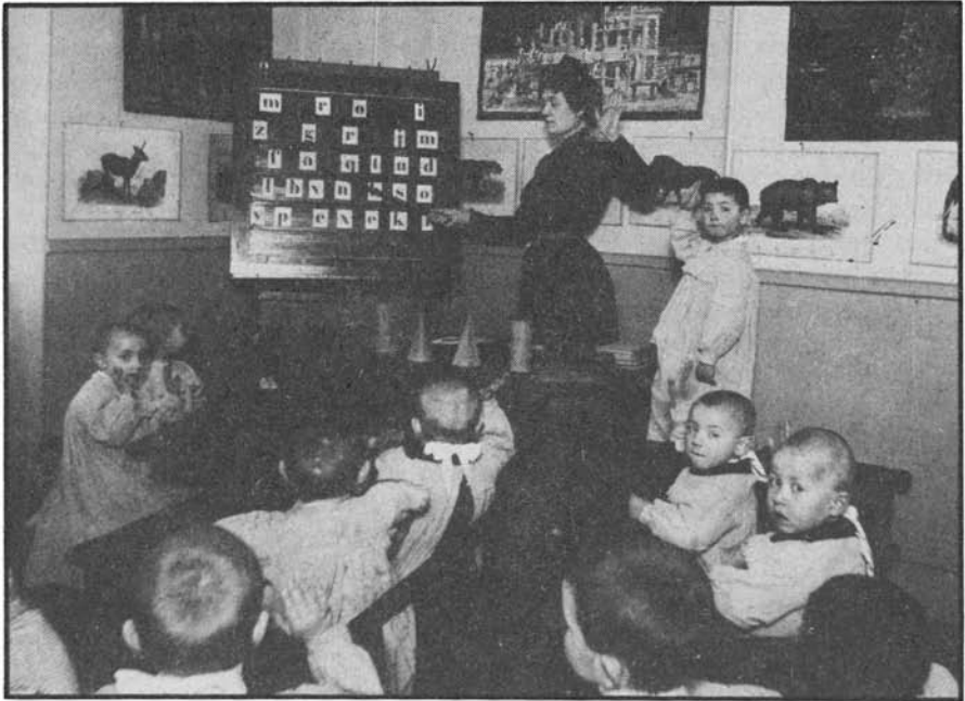
Asile pour enfants

schaft (communauté) à la Gesellschaft (société) n'a pas été la transformation de solidarités généreuses en un égoïsme généralisé.