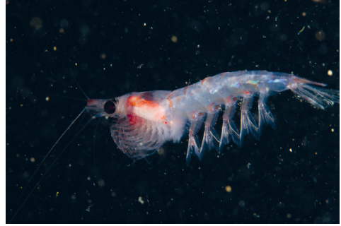
Gros plan d'un krill sous l'eau

Dans certains cas, les impacts anthropiques et climatiques peuvent s'additionner. Le krill de l'Antarctique, l'espèce pélagique la plus abondante de la planète, est ainsi doublement menacé par la surpêche industrielle et le réchauffement des eaux océaniques nuisible à sa reproduction. Or, les krills séquestrent chaque année autant de carbone sous forme de sédiments au fond de l'océan que la totalité du carbone absorbé par les herbiers marins, les marais salés et les mangroves (dit « carbone bleu »).